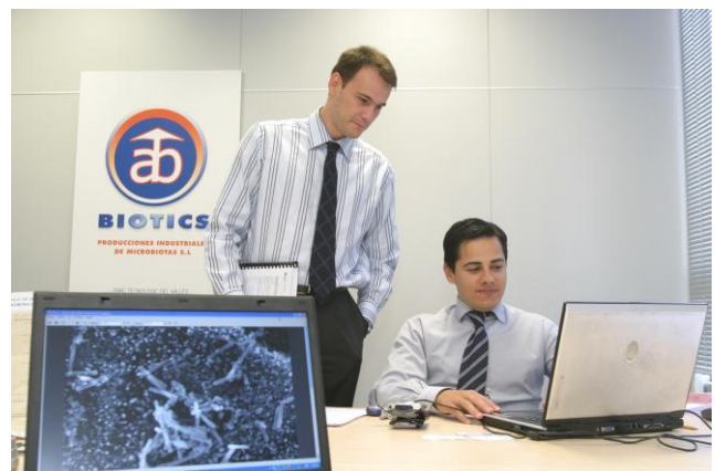
Foto: Sergi Audivert y Miquel Angel Bonachera, Consejeros Delegados de la compañía.

“AB-BIOTICS es una empresa extremadamente dinámica y sumida en un proceso de rápido crecimiento. La flexibilidad y escalabilidad de Sage Murano Online hacen que el programa vaya creciendo con nosotros, adaptándose en cada momento a nuestras nuevas necesidades”, concluye el CLO de la compañía.